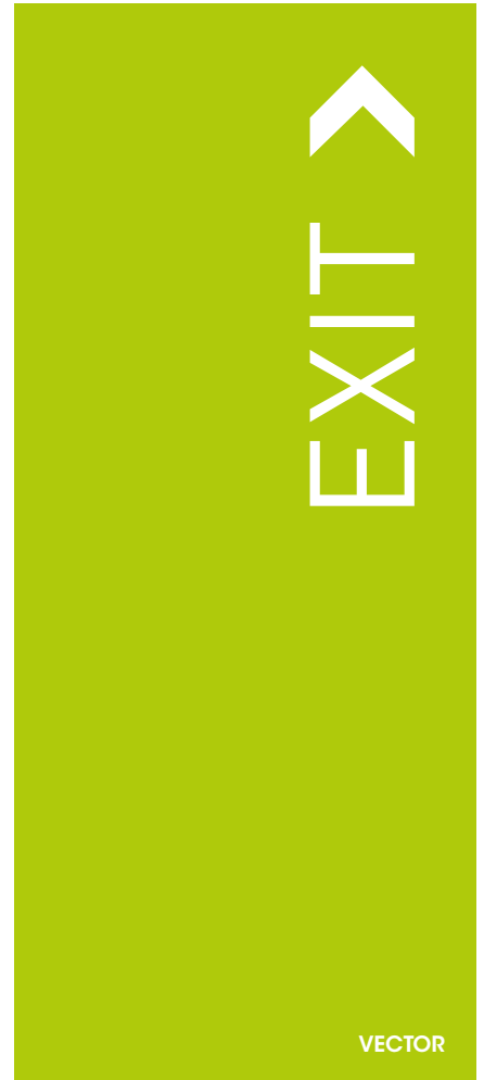
Leitsysteme und Beschriftungen Control systems and labelling Systèmes informatisés et inscriptions

With a durlum texture printing, you can create a special atmosphere in the room. Our textures library comprises pictures of often used materials like wood or concrete. Of course, if you want a special texture, we can print it as well.