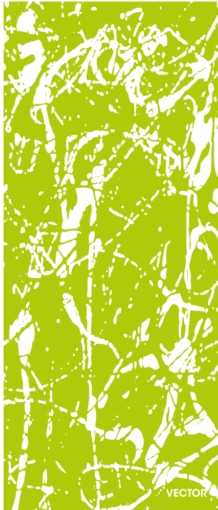
Dekorative Grafiken und Muster Decorative graphics and patterns Graphiques et motifs décoratifs

Mit einer durlum Textur-Bedruckung haben Sie die Möglichkeit, ein besonderes Ambiente im Raum zu schaffen. Unsere Textur-Bibliothek beinhaltet Abbildungen von oft verwendeten Materialien wie Holz oder Beton. Gerne drucken wir auch Ihre Wunschtextur.