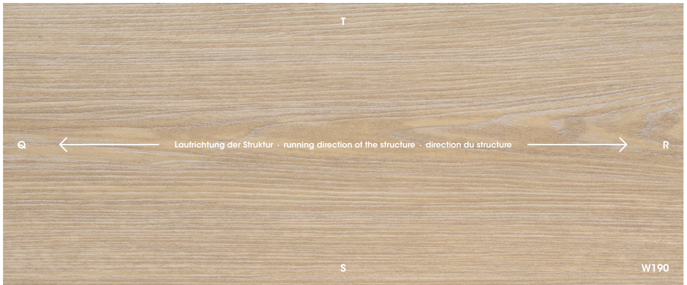
Eiche gekalkt, Whitewashed oak, Chêne chaulé