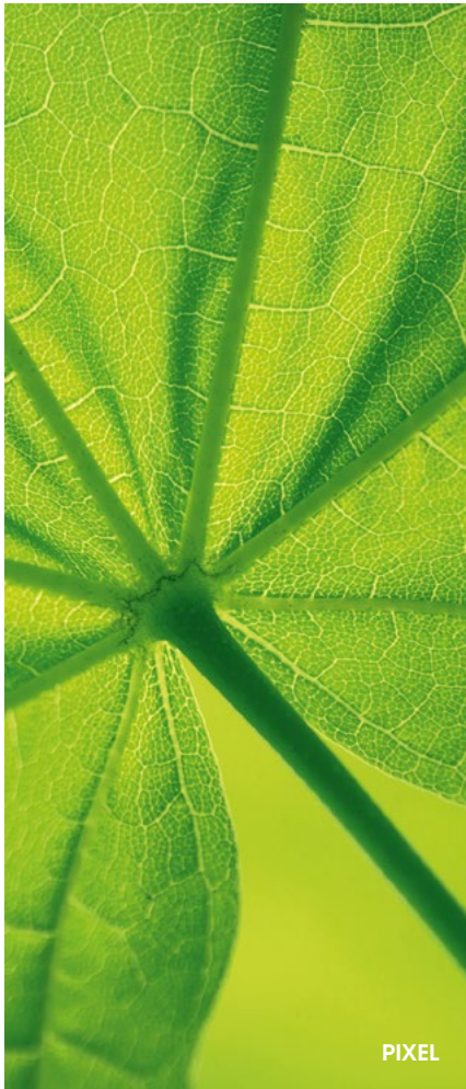
Fotorealistische Abbildungen Photorealistic pictures Représentations photoréalistes